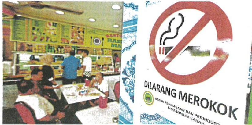
KKM mengeluarkan 5,549 kompaun kesalahan merokok dengan nilai tawaran berjumlah RM1.4 juta pada bulan lalu. (Foto hiasan)

Dr Muhammad Radzi berkata, 642 kes sudah didaftar untuk tindakan mahkamah dan 95 kes disabitkan kesalahan di mahkamah membatalkan jumlah denda RM180,600.