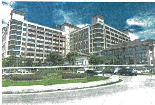
Queen Elizabeth II Hospital currently has 107 beds and a bed occupancy rate of 75 per cent.

"In Sarawak, at the suggestion of Premier Tan Sri Abang Johari Openg, we agreed to build a cancer centre in Kuching.