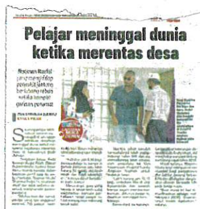
Laporan Sinar Harian pada Sabtu.

Ditanya sama ada pihak sekolah perlu mempunyai maklumat berkaitan status kesihatan pelajar, beliau berkata KKM akan memperhalusi perkara berkenaan. - Bernama