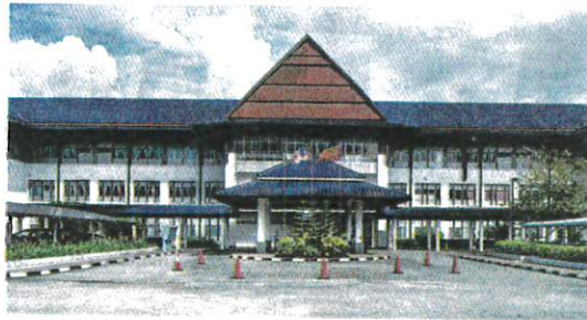
PENDUDUK Langkawi bergantung kepada Hospital Sultanah Maliha untuk rawatan. – GAMBAR HIASAN

Tambahnya, insiden Raja Norway yang dirawat di Hospital Sultanah Maliha (HSM) baru-baru ini boleh dijadikan permulaan kepada pembinaan pusat per-