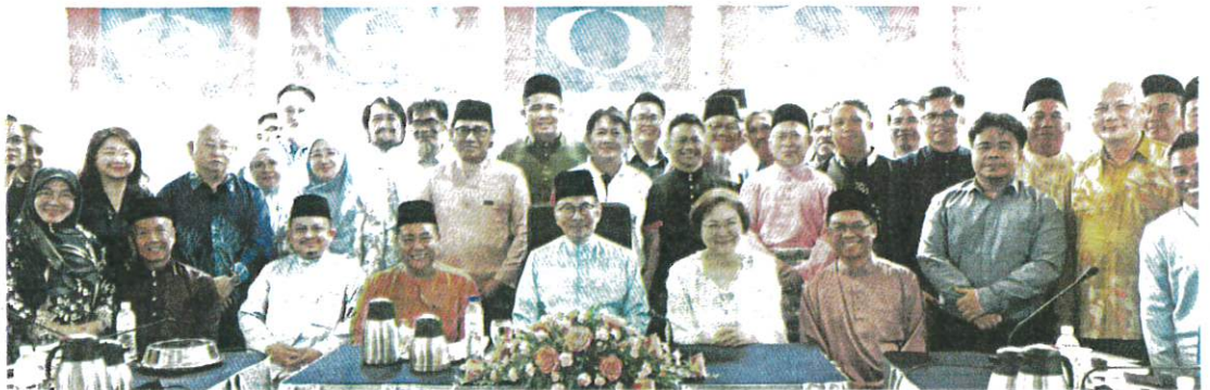
Anwar bersama sebahagian ahli Majlis Pimpinan Negeri PKR Sabah dan Ketua Cabang PKR negeri selepas perjumpaan khas di Kota Kinabalu, semalam.

"Kerja awal untuk menaik taraf Hospital Queen Elizabeth II sebagai Pusat Jantung Negara