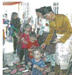
Dr Dzulkefly (kanan) menyampaikan duit raya kepada kanak-kanak ketika menghadiri Sambutan Aidilfitri Amanah Johor di Parit Keroma, Muar pada Sabtu.