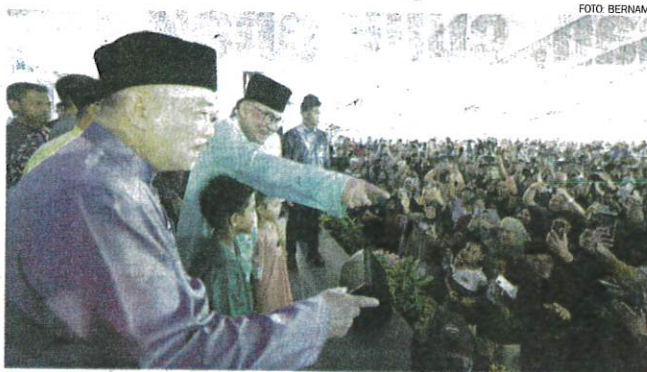
Anwar bersama Ketua Menteri Sabah, Datuk Seri Hajiji Noor beramah mesra dengan orang ramai pada Majlis Sambutan Aidilfitri Madani 2024 Peringkat Kebangsaan di Kota Kinabalu pada Sabtu.

gera. Di Sarawak atas cadangan Premier Sarawak, Tan Sri Abang Johari Tun Openg, kita setuju dengan dana awal beri kerajaan Sarawak menubuhkan Pusat Kanser Negara Kuching.